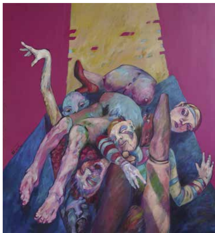
Cecilia Jaime, Lo que fué de Pandora en su caja? , 1987, acryl op doek

Ze heeft in het laatste decennium van vorige eeuw ook gewerkt rond fotografie en video, waarbij het haar vooral ging om de weergave van de beweging en de beleving van het lichaam.