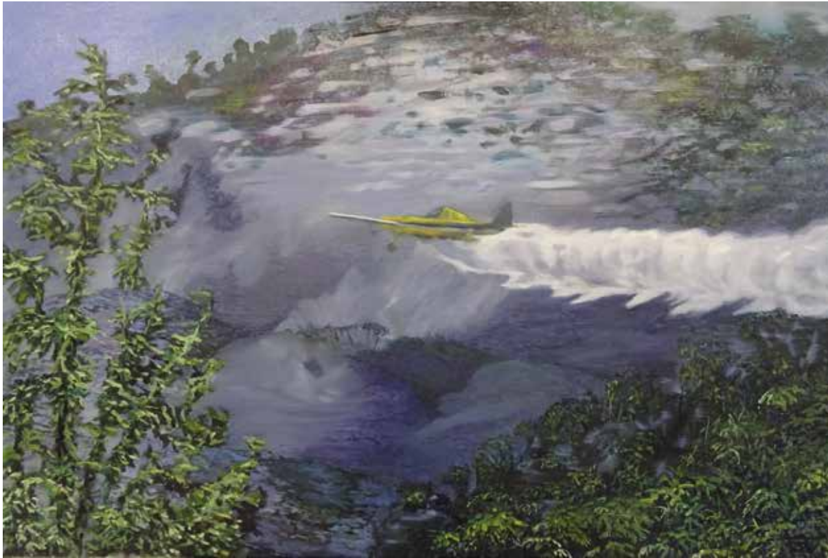
Cecilia Jaime, Flying once again and again , 2021, olieverf op doek, 120 x 90 cm

Ze maakte daarvoor tijdens een verblijf in Argentinië opnames in een woestijngebied. Haar project mondde uit in een solotentoonstelling in het Brouwerijgebouw van het Caermersklooster in Gent waarbij ze zowel schilderijen, beelden als foto's en video werk presenteerde.